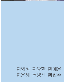
황의정 황요한 황예은 황은혜 윤영선 황갑수